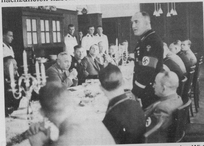
Sprecher = SS-Brigadeführer Oswald Pohl, Leiter des Wirtschafts- und Verwaltungshauptamtes, anlässlich eines Besuches von Reichsorganisationsleiter Dr. Robert Ley (ihm gegenüber) in Dachau.

Die zu analysierenden Korrespondenzakten des Tatkomplexes Dr. Rascher haben diesen Entwicklungsgang durchlaufen und sind bislang niemals von neutralen Forschern "durchleuchtet" worden. Wir werden das nachzuholen haben.