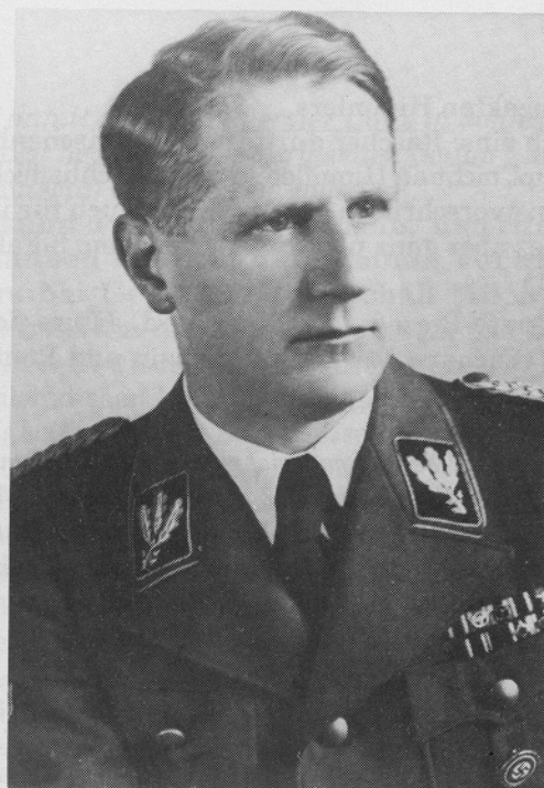
Leonardo Conti, seit 1939 Staatssekretär für Gesundheitswesen und Volkspflege im Reichs- und Preußischen Ministerium des Innern und damit Reichsärztführer, ab August 1941 Mitglied des Reichstages, 1944 SS-Obergruppenführer. In alliierter Haft verstorben (Selbstmord?).