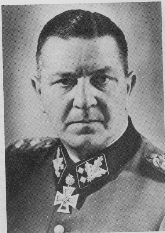
Theodor Eicke, erster Lagerkommandant von Dachau, 1934 - 1939 Inspekteur der Konzentrationslager (sein Nachfolger als Inspekteur der KL bis 1945 SS-Brigadeführer Richard Glücks), 1939 erster Kommandeur der SS-Division "Totenkopf", am 26.2.1943 als SS-Obergruppenführer und General der Polizei bei einem Flugzeugabsturz bei Orelka/Rußland ums Leben gekommen.

Im Ärzteprozeß 1946/1947 wußte man von einer Fälschung der gesamten Korrespondenz zwar nichts, hätte auch kaum gewagt, solches vor Gericht auszusprechen -- weil die Verteidigung für eine Beweisführung eines solch schwerwiegenden Vorwurfes weder Zeit noch Möglichkeiten hatte --, doch sind die Unrichtigkeiten im Inhalt der Papiere damals schon aufgefal-