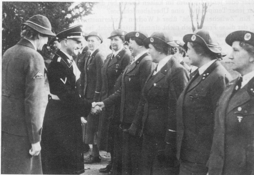
SS-Obergruppenführer Dr. Ernst Grawitz, Leiter des Deutschen Roten Kreuzes sowie Reichsarzt der SS und Polizei, begrüßt in der neu eröffneten Reichsführerschule des Deutschen Roten Kreuzes in Groß-Schulzendorf die Teilnehmerinnen am ersten Lehrgang. Dr. Grawitz beging im April 1945 Selbstmord.

Gliederung und Absatzgestaltung sind verworren,