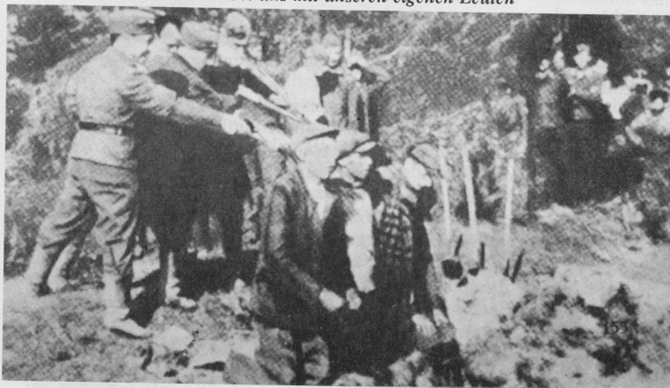
"Im Osten" aus: Robert Neumann, "Hitler -- Aufstieg und Untergang des Dritten Reiches, ein Dokument in Bildern" , München - Wien - Basel 1961, S. 155.

Niemand bezweifelt, daß es ähnliche Szenen während des Rußlandfeldzuges gegeben hat, doch dieses Bild ist Malerei und daher keine "Dokumentation". Außerdem stellt der in dem genannten Buch vermittelte Eindruck, die deutsche Wehrmacht habe unentwegt friedliche Zivilisten gemordet, die Realitäten bestialischer sowjetischer Partisanenkriegführung total auf den Kopf. Würden wir Deutsche solche Bilder mit sowjetischen, polnischen, tschechischen, jugoslawischen, französischen, amerikanischen Mordschützen in Umlauf bringen, so würden wir, obgleich es unzählige solcher Szenen tatsächlich gegeben hat, wegen Volksverhetzung im Gefängnis landen.